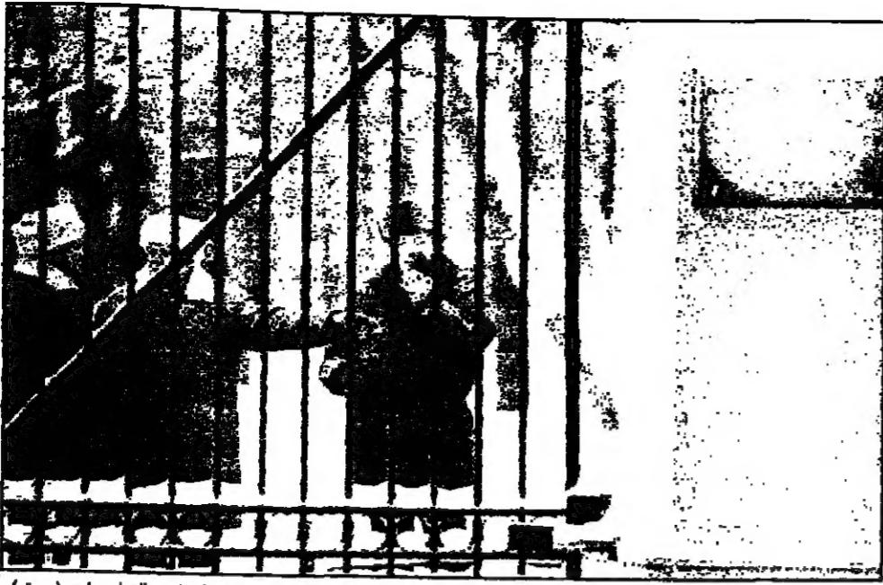
يغور غايدار وزير الاقتصاد الروسي السابق.

عندما اجريت الانتخابات عمليا في قلب في الخامس من تشرين الثاني (نوفمبر) وقد استقال رئيس الدولة ممارسة مهامه منذ ذلك الحين. وقال غايدار في بيان له اليوم إن روسيا ستبذل كل ما في وسعها لحماية استقلال الشيشان من الانفصال عن الاتحاد السوفياتي.